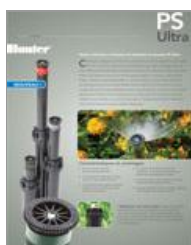
PS ULTRA BROCHURE